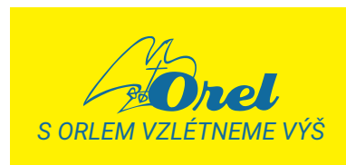
Nedodržení poměru loga a písma v deskriptorech

V případě pochybností je nutné kontaktovat generálního sekretáře Orla.